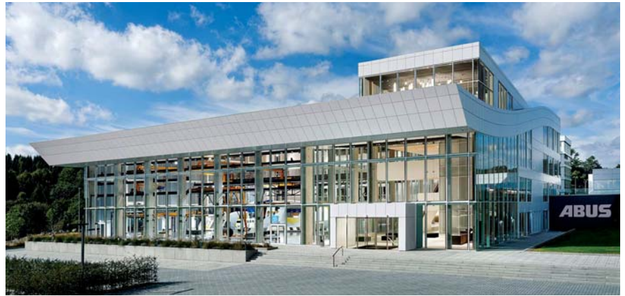
Příklady realizovaných zakázek z produkce ITECO-ABUS

Školící a předváděcí středisko KranHaus firmy ABUS v německém Gummersbachu