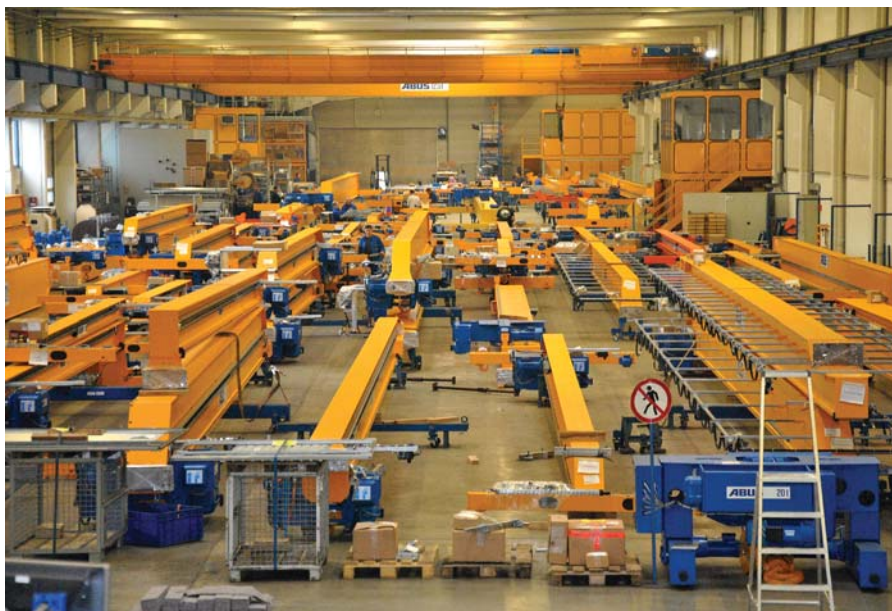
Dokonale organizované precizní výrobně-montážní haly opouští 5 000 ks jeřábů ročně

vah, doplnění radiových dálkových ovládní, řešení kolizních stavů s jinými stroji apod. Nutno říci že se jedná typově o nejnáročnější úlohy. Produktový specialista se věnuje výhradně této práci a společně s výrobcem posuzuje jednotlivé případy. Nestačí skončit u jeřábu, ale je nutno posoudit i dimenze souvisejících prvků jako trolejí, jeřábových dráh, atd. V případě prošlých životností zdvihových jednotek se postaráme o jejich generální opravu nebo výměnu.